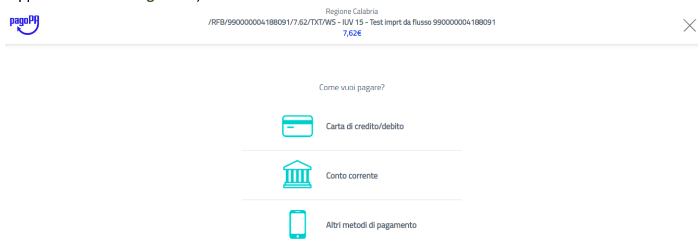
Figura 17 - Modalità di pagamento online

Tramite questa sezione sarà possibile effettuare un pagamento online tramite diverse modalità (come rappresentato nella Figura 17 ).