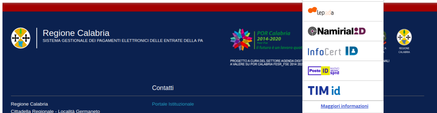
Figura 10 - Accesso tramite SPID